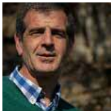
Sito Piella Vila Portaveu Batec d'aire per SQS (CiU)

L'altre dia vaig escoltar per la radio una tertúlia entre un economista, veí de Sant Quirze, i un polític on es debatién el tema de les retallades. L'economista explicava que van ingressar un dels seus néts a un Hospital, i al estar a l'habitació van demanar unes mantes a la infermera. Aquesta els hi va explicar que no en disposaven suposadament per culpa de les retallades, i exposava que si s'haguessin gestionat més bé els diners públics possiblement això no li hagués passat. El polític li va recriminar que això era demagògia.